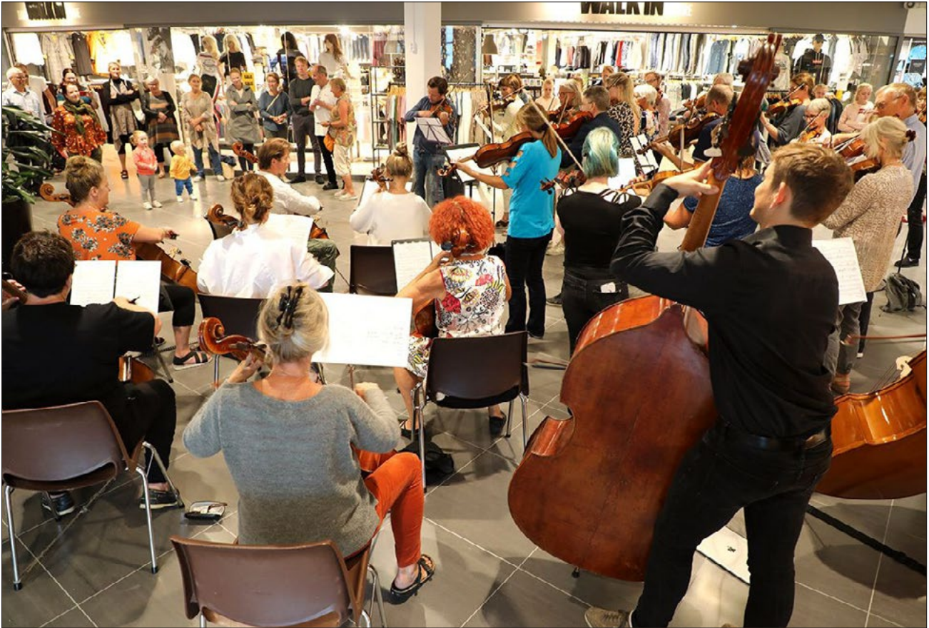
ØVER: 70 musikantar kjem til Eid for å øve og underhalde.