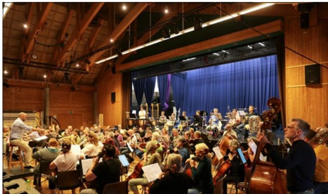
TRAVEL VEKE: Sommarsymfonien starta 30. juli og har sidan då hatt kurs og øvingar på Folkehøgskulen på Eid. Det heile blir avslutta med ein konsert i Operahuset 6. august.

Folkehøgskule, og så hørte eg så flott harpemusikk frå eit øvingsrom. Då måtte eg berre sjekke det ut. Det er litt sjeldan ein har harpe i slike orkester, så då ville eg få ho med til Nordfjordeid på Sommarsymfonien, fortel Jan Ola.