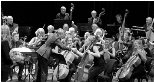
SYMFONI: I år deltar 75 amatørmusikarar på Vestlandsk Sommarsymfoni.