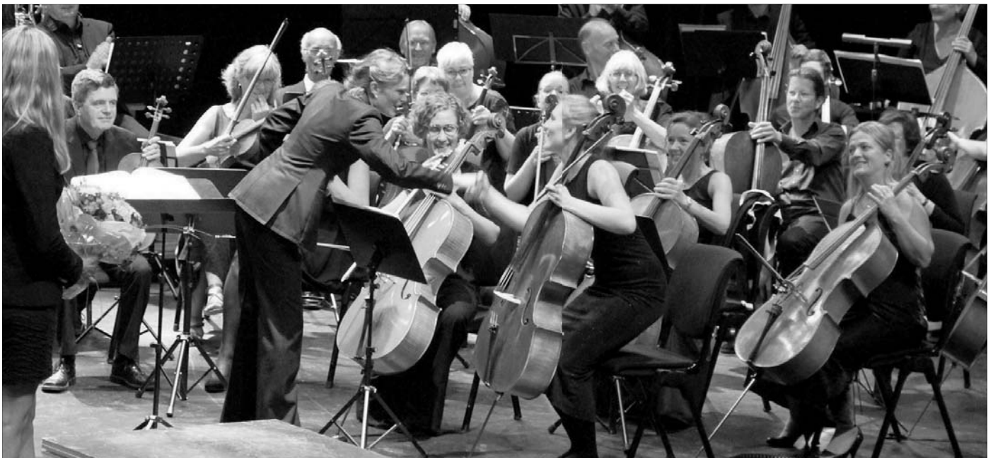
TRADISJONSRIK SYMFONI: Frå ei tidlegare oppsetting av Vestlandsk Sommarsymfoni.

● Vestlandsk sommarsymfoni samlar 75 amatørmusikarar frå heile landet på Nordfjordeid