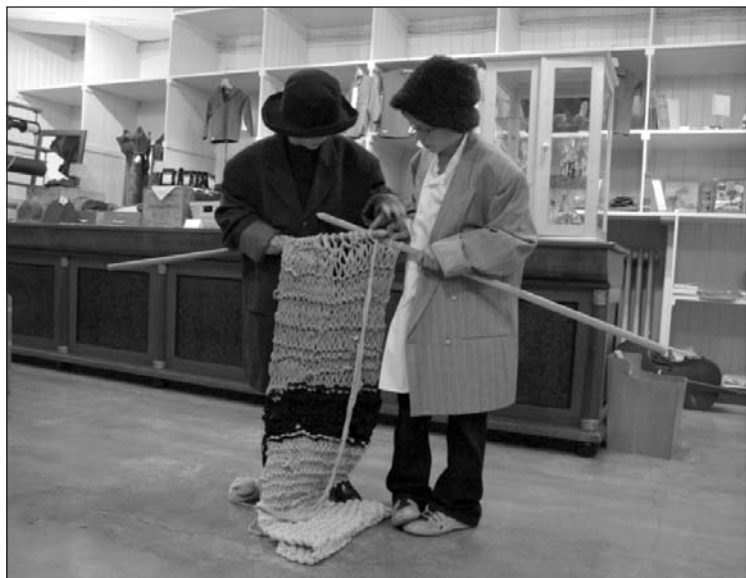
Juniormusikantene kunne mer enn å spille.