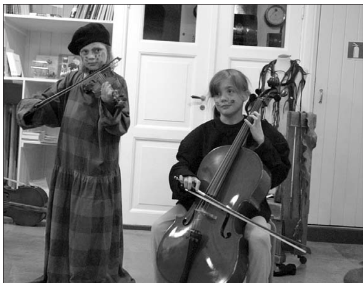
Juniormusikantene var med på denne spesielle konserten omkring i museet.