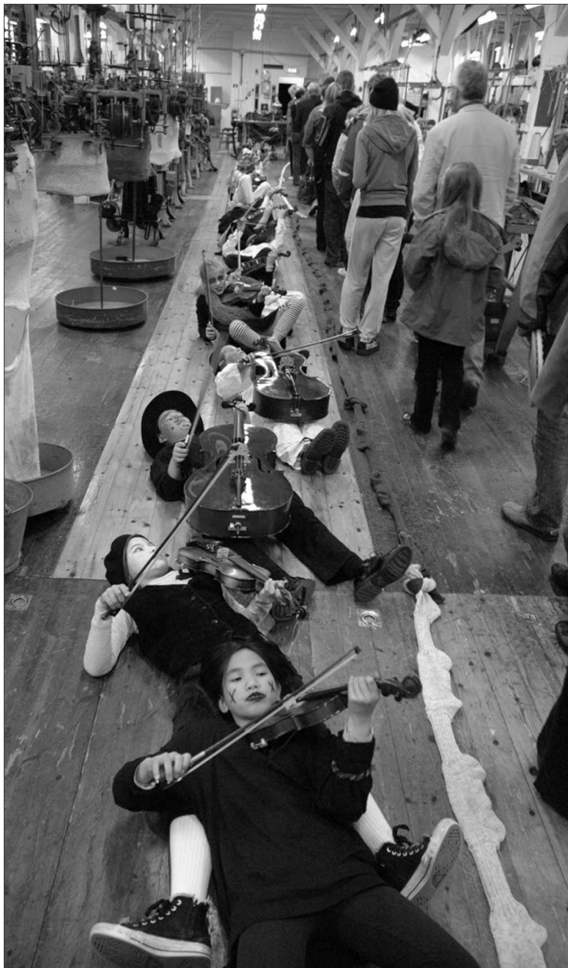
Musikantene spilte for den lange rekken av tilhørere som om de var en del av maskinene ved den gamle Tricotagefabrikken på Salhus.