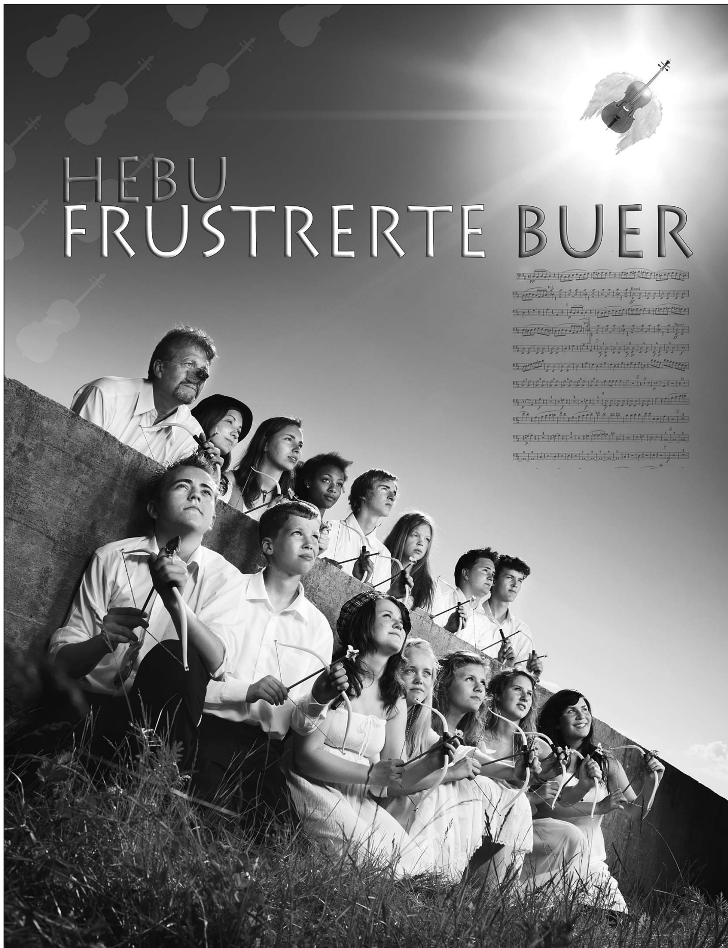
Frustrerte Buer