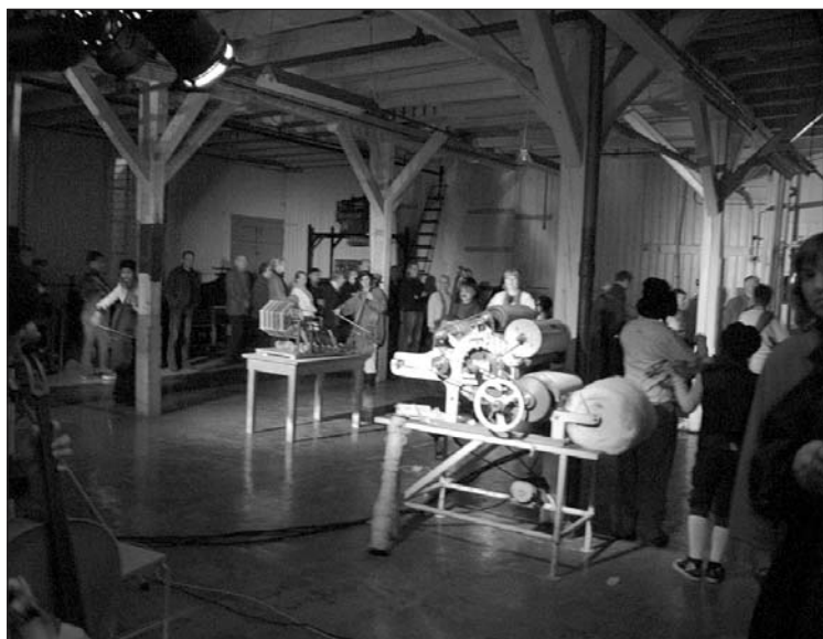
Med lyssetting og store rom ble det skapt en trolsk atmosfære og en opplevelse som om vi var i en katedral.